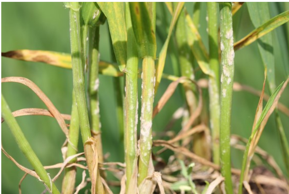
Billede 3. Meldug i hvedesorten Torp fotograferet 15. maj 2017.