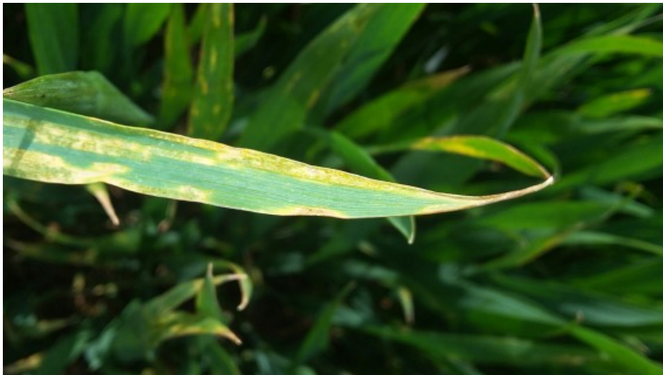
Billede 2. Samme som billede 1. Gulrust i hvedesorten Benchmark ved Åbenrå. Fotograferet 11. maj 2017 af Mogens Munk, LandboSyd.