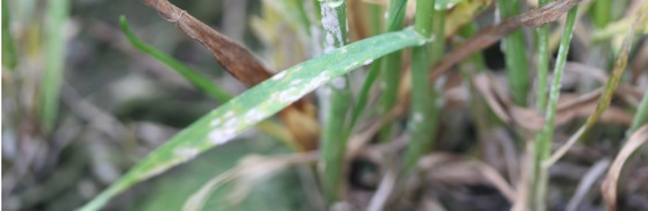
Billede 4. Samme som billede 3. Meldug i hvedesorten Torp fotograferet 15. maj 2017.